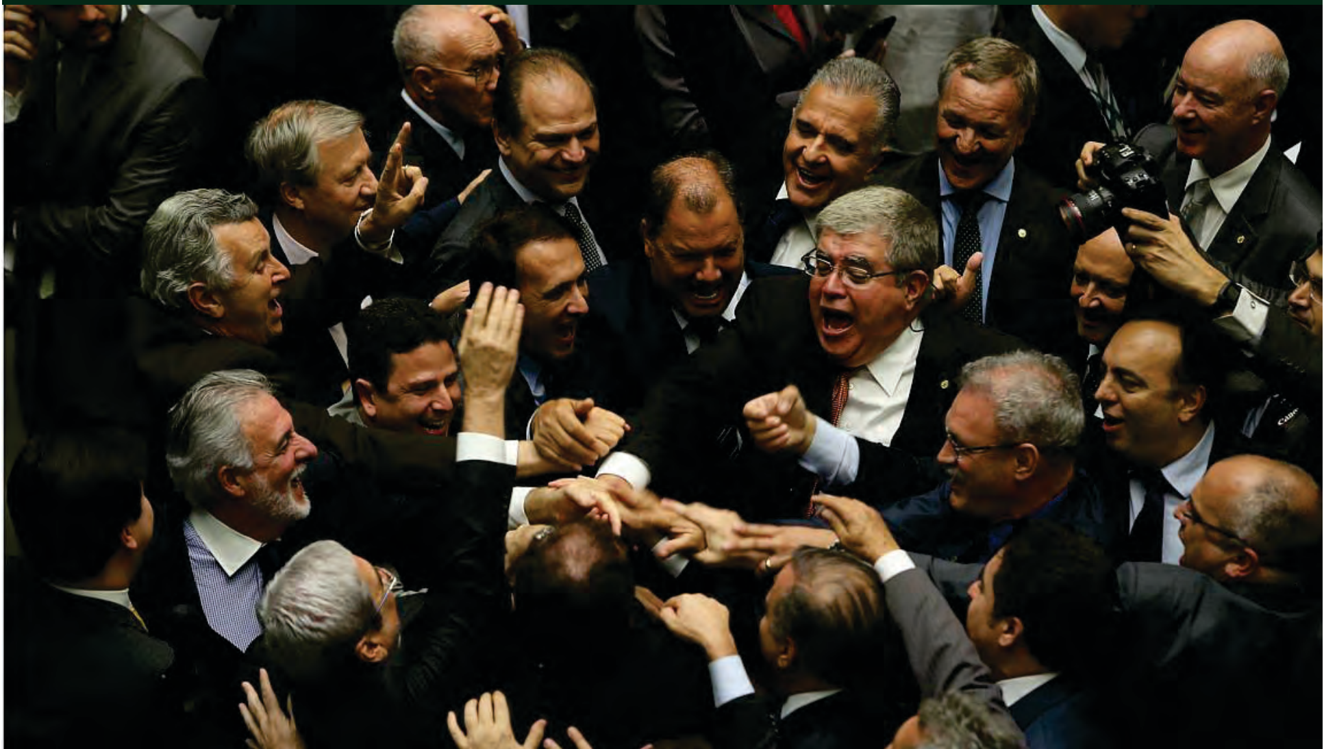
Foto: Deputados comemorando vitória do Governo contra os trabalhadores