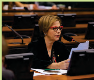
TEREZA CRISTINA (PSB)