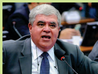
CARLOS MARUN (PMDB)